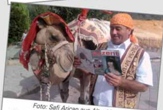
Foto: Safi Arican aus Altenkirchen (Kamelskönig à Feridun Karadeniz aus Pamukkale Denizli Türkei)