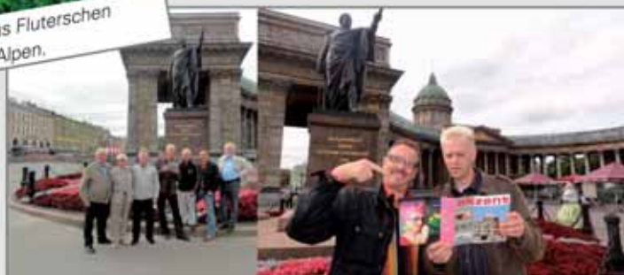
Foto: Kersten Sauer aus Fluterschen Conbrinos on Tour in St. Petersburg, Russland