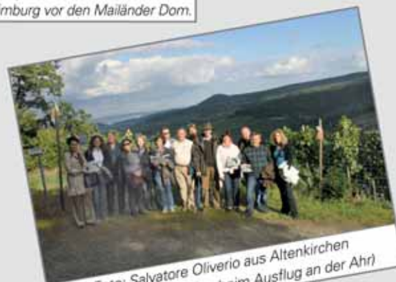
(Aktionskreis in Aktion beim Ausflug an der Ahr)